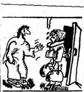
— Свежая газета? Ну-ка, ну-ка...