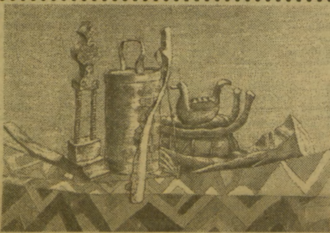
Логинов В. Натюрморт, 1992.