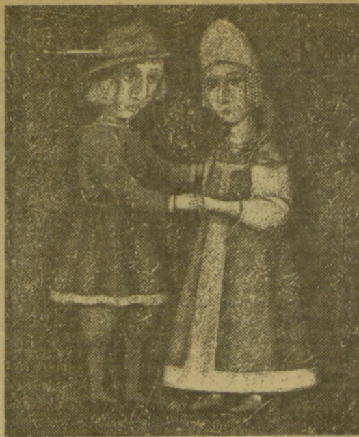
Каковкина Г. Портрет молодого человека, 1990.