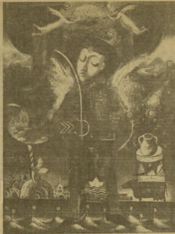
Данилов А. Солдатский рай, 1992.