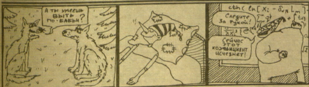
Рисунки ИГОРА БЕРЕЖНОГО, пятикурсника физфака.

АНДРЕЙ КОТЕЛЬНИКОВ, 4 курс исторического факультета.