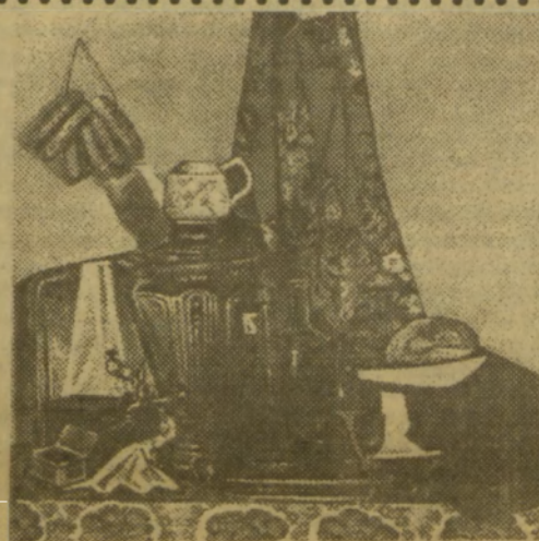
Грачев В. Натюрморт с самоваром, 1990.