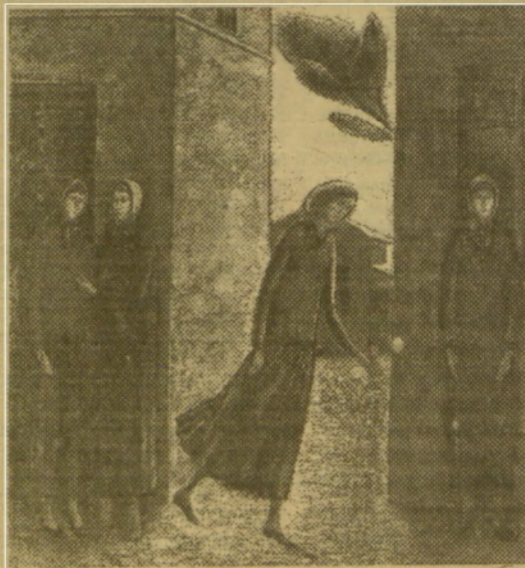
Васильченко Я. День ангела, 1992.