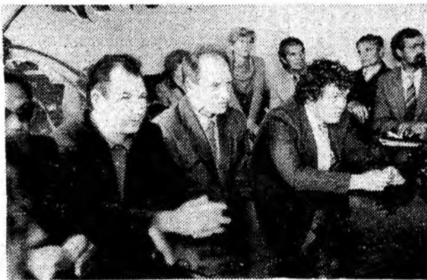
НА СНИМКАХ: На вручении дипломов слушателям университета марксизма-ленинизма.