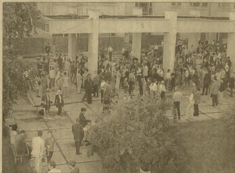
Во время вступительных экзаменов в Самарский государственный университет.

БЕСЕДОВАЛА О.ШПРШОВА, «Самарская неделя», 13 сентября 2002 г.