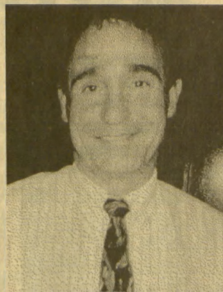
Лорен Шихан, профессор университета Голден Гейт в Сан-Франциско, эксперт по международному праву, прочитал курс лекций на юридическом факультете СамГУ для группы студентов, владеющих английским языком. Тема - права человека.

нов мирового сообщества. Нынешнюю ситуацию в России можно охарактеризовать словами американской поговорки, которая буквально гласит: «Вы еще не вышли из леса». Это означает, что вы еще не оставили все трудности позади. И несмотря на то, что вы движетесь в правильном направлении, вызывает беспокойство тот факт, что в стране есть определенные силы, которые выступают против насущных прав человека.