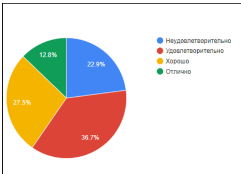
Рисунок 2. Результаты анкетирования студентов на тему «Восприятие студентами проводимой государственной молодежной политики в РФ»

Таким образом, результаты анкетирования показали, что больше 50% студентов моего вуза не совсем довольны проводимой молодежной политики по следующим причинам: