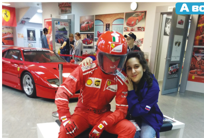
А волонтеры были!

«Основной отбор прошёл в формате интервью с рекрутером. Плюс мы отправляли табличку по нашему