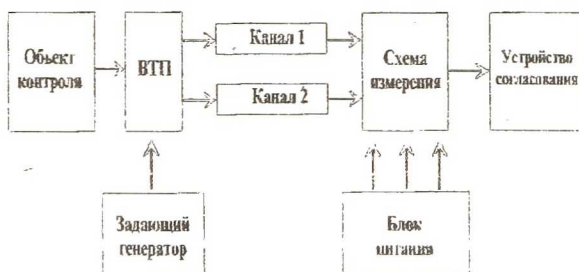
Рис. 1. Структурная схема устройства для измерения угловых перемещений.

Вихретоковый метод измерения нашел наиболее широкое распространение для контроля объектов в динамических режимах их работы. Особенностью метода является его высокое быстродействие, инвариантность результатов контроля к диэлектрическим свойствам среды в зоне расположения вихретокового преобразователя, локальный контроль единичных элементов конструкции, надежность и простота вихретокового датчика. В устройстве для измерения угловых перемещений применен вихретоковый метод измерения. Структурная схема устройства для измерения угловых перемещений представлена на рис. 1.