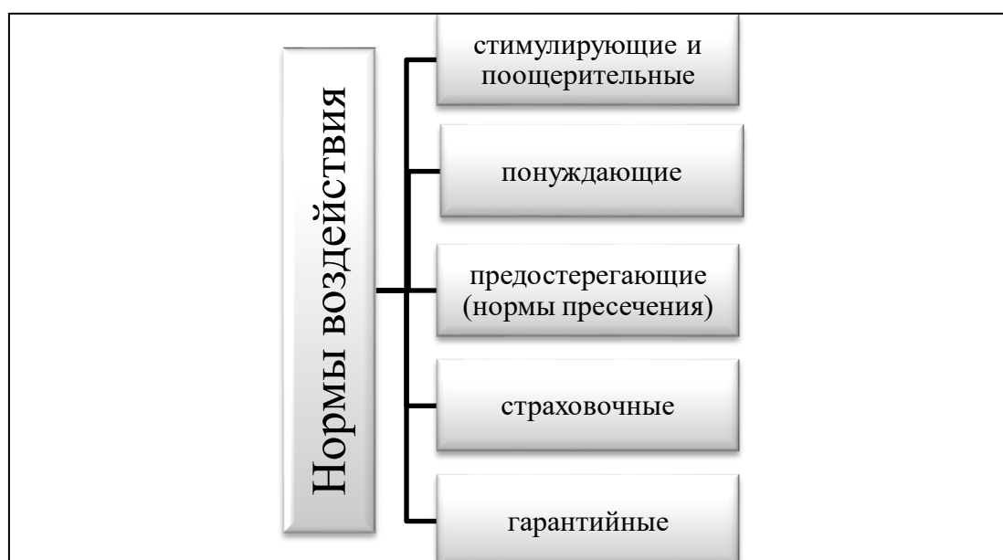
Рисунок 1. Нормы воздействия на поведение природопользователя [4]

Выполнение задач на государственном уровне требуют четкого и своевременного воздействия через соответствующие нормы (Рисунок 1).