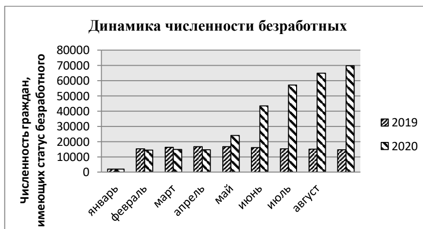
Рисунок 1 - Динамика численности не занятых трудовой деятельностью граждан, состоящих в органах СЗН

По данным Министерства труда, занятости и миграционной политики Самарской области к концу августа 2020 в органах службы занятости населения состояли на учете 73,5 тыс. незанятых трудовой деятельностью граждан, из них 69,8 тыс. имели статус безработного (Рисунок 1). [12]