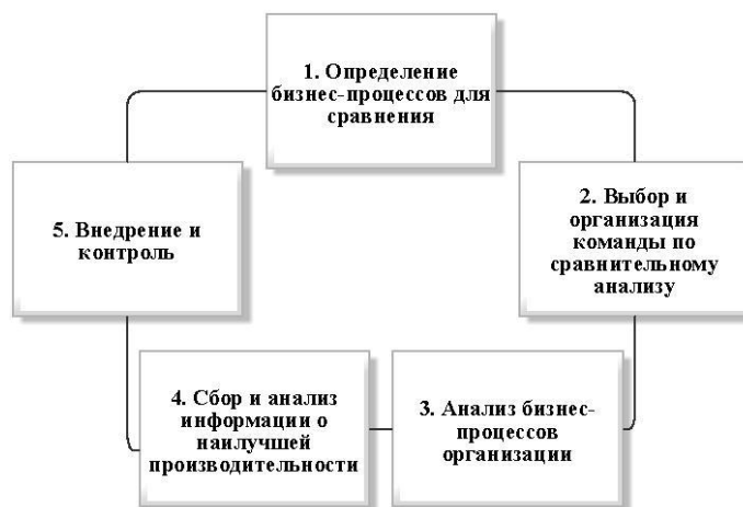
Рисунок 2. Этапы бенчмаркинга бизнес-процессов [2]

В рамках данной статьи особое внимание будет уделено бенчмаркингу бизнес-процессов (рис.2). Обновление бизнес-процессов обычно приводит к значительной экономии средств для организации, а также к более рациональному подходу, обеспечивающему максимальное качество.