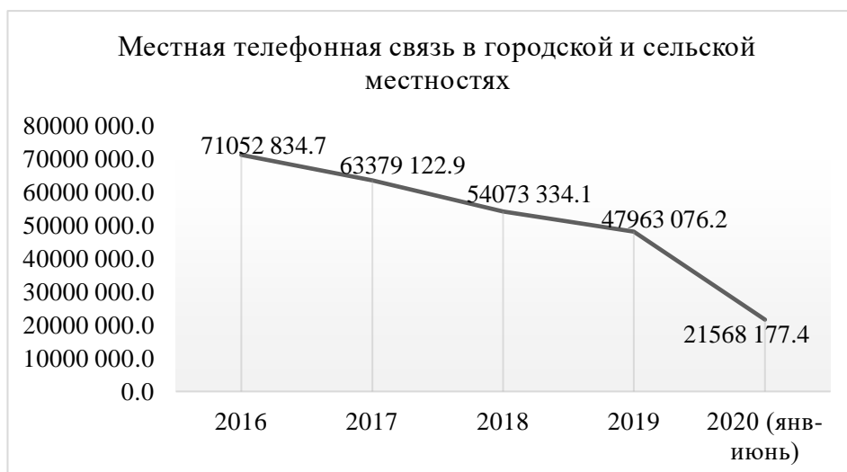
Рисунок 2. Объём оказанных населению услуг по предоставлению местной телефонной связи в городской и сельских местностях за период 2016-2020г.

первое место занимает компания «Ростелеком», на долю которой приходится 60% оказываемых услуг [2].