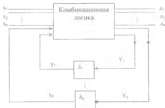
Рис. 2. Структурная схема асинхронной последовательной схемы

Для правильной работы асинхронной схемы, в большинстве случаев представляющей функционирование систем БКО, необходимо выполнение следующих условий.