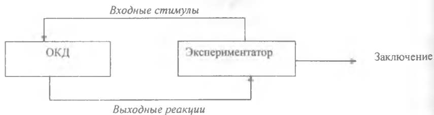
Рис. 4. Простой мысленный эксперимент