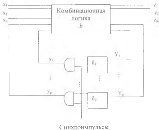
Рис. 1. Структурная схема синхронной последовательной схемы