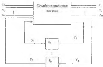
Рис. 2. Структурная схема асинхронной последовательной схемы

Для правильной работы асинхронной схемы, в большинстве случаев представляющей функционирование систем БКО, необходимо выполнение следующих условий.