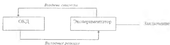
Рис. 4. Простой мысленный эксперимент

Рассмотрим два типа мысленных экспериментов: простые (рис. 4) и кратные (рис. 5).