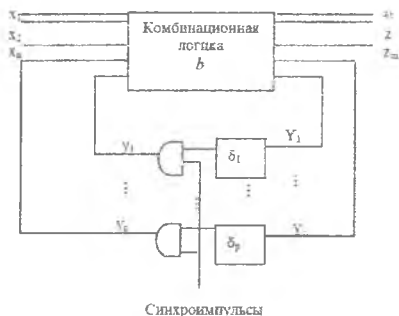
Рис. 1. Структурная схема синхронной последовательной схемы