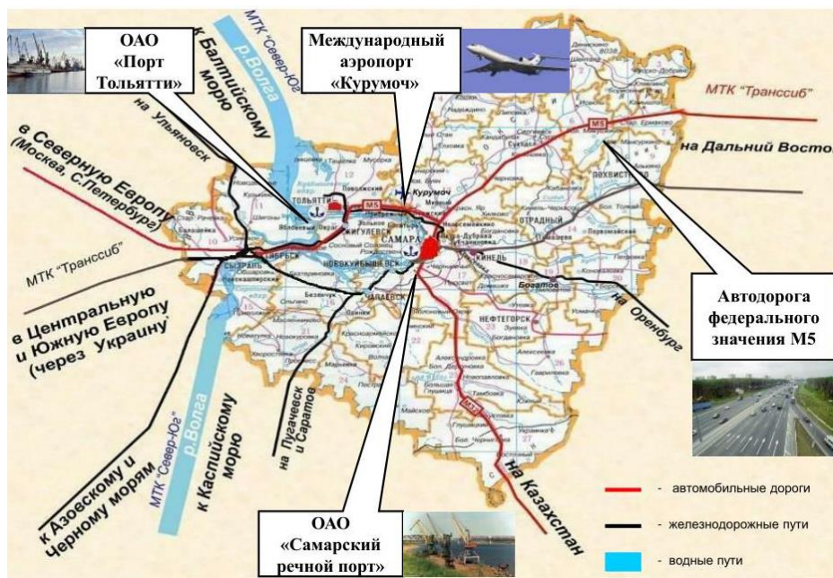
Рисунок 1. Инфраструктурный потенциал Самарской области