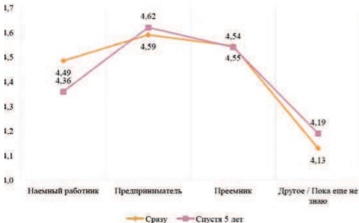
Рис. 1. Роль обучения в вузе и карьерные предпочтения российских студентов

предпринимателями, также отмечают, что занятия улучшили их способность выявлять возможности для бизнеса и усовершенствовали практические управленческие навыки, необходимые для создания своего бизнеса.