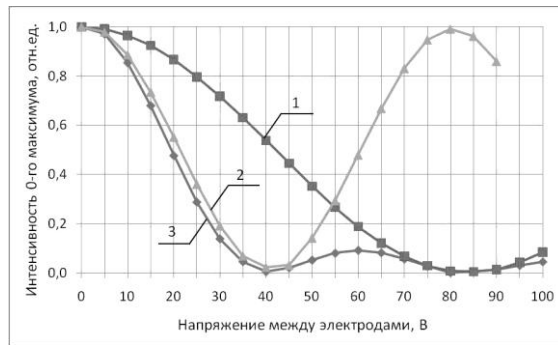
Рисунок 2. Изменение интенсивности нулевого максимума различных УДОЭ: 1 – амплитудный УДОЭ; 2 – фазовый УДОЭ; 3 – амплитудно-фазовый УДОЭ

Согласно полученным данным, наибольшим управляющим напряжением ( \approx 85 В) обладают амплитудные УДОЭ, наименьшим – амплитудно-фазовые УДОЭ ( \approx 40 В). По сравнению с амплитудными и фазовыми УДОЭ амплитудно-фазовые элементы обеспечивают большую глубину модуляции. Для амплитудно-фазовых УДОЭ (кривая 3 на рис.2) в области межэлектродных напряжений 0 – 40 В – действия дифракционного и поляризационного механизмов совпадают и направлены на снижение интенсивности 0-го максимума. В области 40 – 85 В действия дифракционного и поляризационного механизмов противоположны, однако механизм дифракционного изменения преобладает и обеспечивает увеличение интенсивности 0-го максимума. В области 85 – 100 В механизмы дифракционного и поляризационного изменения интенсивности совпадают и направлены на снижение интенсивности 0-го максимума.