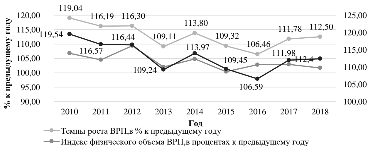
Рисунок 1 - Динамика валового регионального продукта в Иркутской области

Ретроспективный анализ позволяет утверждать, что 2018 год в регионе именуется как год экономического развития. За последнее десятилетие валовая добавленная стоимость выросла почти в 3 раза (Рисунок 1). В 2018 году по сравнению с 2017 годом ВРП увеличился на 12,5% (на 149 010 млн.руб. в абсолютном выражении). Отмечается рост ВРП на душу населения более чем в 2 раза.