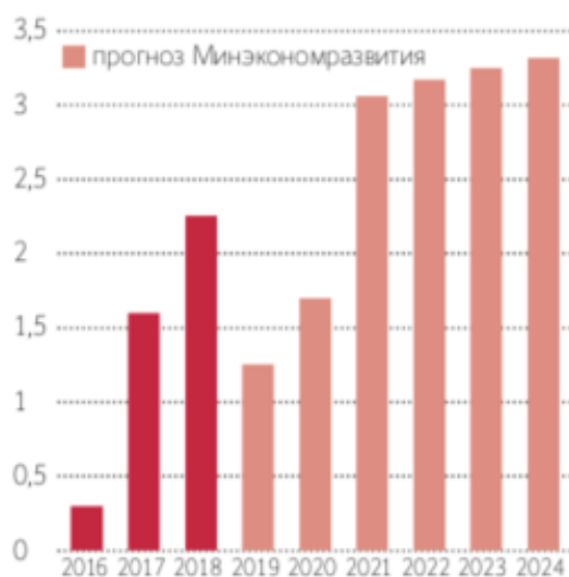
Рисунок 3 - Прогноз темпов роста ВВП России, в %

Каковы же перспективы экономического роста в России? Аналитики Fitch Ratings считают, что в 2020–2022 гг. экономика ускорится до 1,9%, но выше 2% ВВП вряд ли будет расти. Это существенно ниже медианного прогноза для стран с таким же рейтингом ВВВ (3,1%). С 2021 г. ВВП будет расти более чем на 3% вплоть до 2024 г. На рисунке 3 представлен прогноз роста ВВП в России [3].