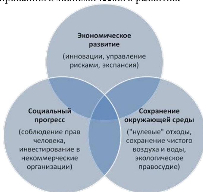
Рисунок 1 - Факторы, определяющие динамику экономического роста

На практике это означает изменение направления национальной экономической политики: от работы, стимулирующей высокие темпы роста производства, до создания благоприятных условий для эффективного и социально ориентированного экономического развития.