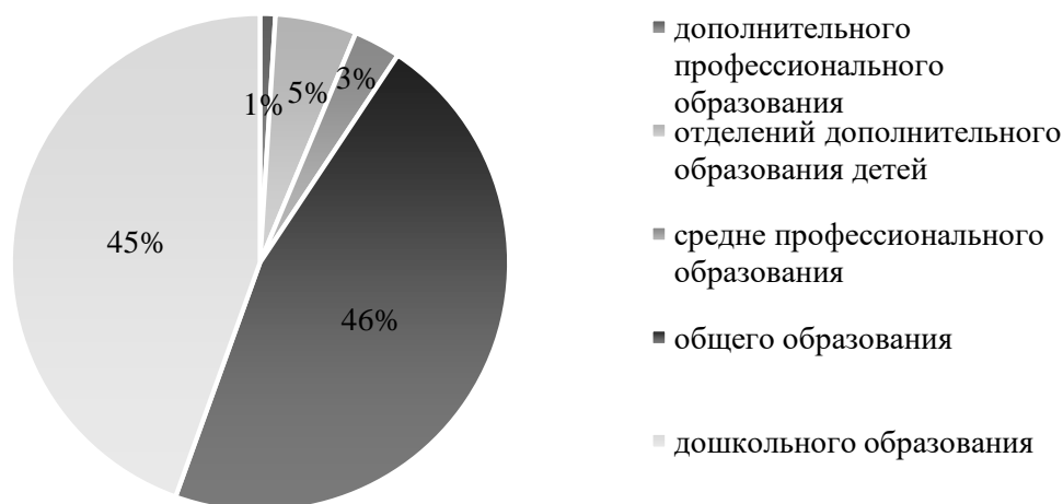
Рисунок 1 - Организации в сфере образования Иркутской области [2]

От того как будет организована работа данной системы во много зависит и качество жизни в отдельном муниципальном образовании, а, следовательно, и в регионе в целом. Правильно построенная система управления образованием поможет создать такие условия, которые смогут удовлетворить текущие потребности населения, что поможет повысить качество жизни людей, проживающих на территории Иркутской области.