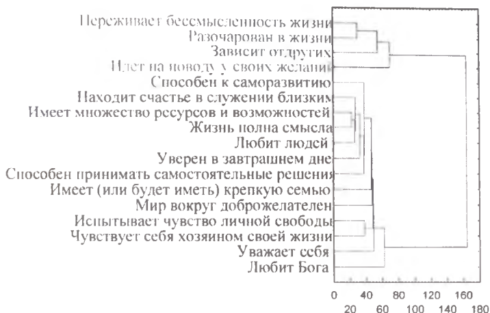
Рис. 2. Содержательная характеристика выделенного фактора при исследовании сознания наркозависимых, проходящих реабилитацию по религиозным программам

У наркозависимых, проходящих реабилитацию по нерелигиозным методикам, в отличие от первой выборки, обнаруживается внутрличностный конфликт, из-за несоответствия актуального и желаемого уровня развития личности, что может порождать психологическое напряжение, и, как следствие, угрозу рецидива (рис. 3).