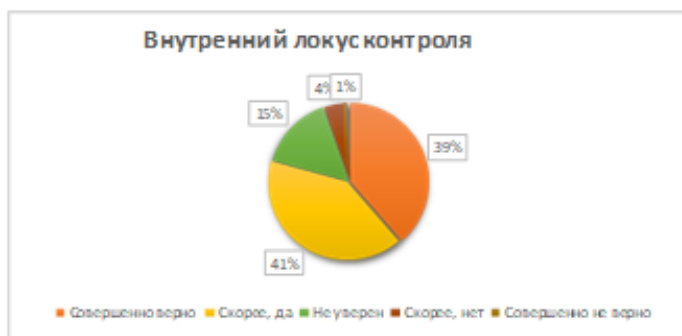
Рис. 4. Распределение ответов на утверждения, связанные с компонентом проактивности «внутренний локус контроля»

Как показал анализ, другим доминирующим компонентом проактивности у опрошенных студентов является «внутренний локус контроля». Абсолютное согласие с суждениями, выявляющими данный компонент, высказали 39% респондентов. Согласились с его наличием еще 41%. Таким образом, у абсолютного большинства участников опроса (80%) в поведении присутствует данный компонент проактивности (рис. 4).