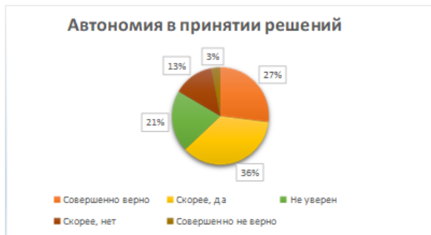
Рис. 5. Распределение ответов на утверждения, связанные с компонентом проактивности «автономия в принятии решений»

как «автономия в принятии решений» высказали 27% респондентов. Согласились с его наличием еще 36% опрошенных студентов. Таким образом, у более половины участников опроса (63%) в поведении присутствует данный компонент проактивности (рис. 5).