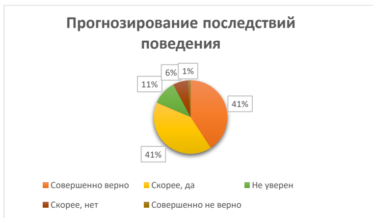
Рис. 2. Распределение ответов на утверждения, связанные с компонентом проактивности «прогнозирование последствий поведения»

Абсолютное большинство участников опроса (82%) ответили положительно на суждения, отражающие наличие в поведении такого компонента проактивности, как «прогнозирование последствий поведения». Абсолютное согласие высказали 41% респондентов. Согласились с его наличием столько же – 41%. Таким образом, можно говорить о хорошо развитой способности респондентов к прогнозированию собственного поведения (рис. 2).