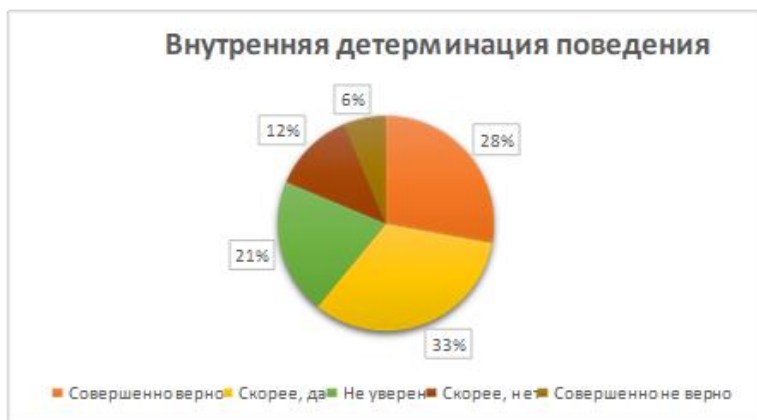
Рис. 7. Распределение ответов на вопросы, связанные с компонентом проактивности «внутренняя детерминация поведения»

Результаты анкетного опроса подтверждают, что более половины респондентов (63%) в повседневной жизни при выборе моделей поведения стараются ориентироваться преимущественно на собственные установки, взгляды и убеждения. Абсолютное согласие с суждениями, выявляющими внутреннюю детерминацию поведения, высказали 28% респондентов. Согласились с его наличием в собственном поведении еще 33% участников опроса (рис. 7).