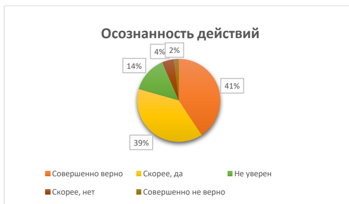
Рис. 1. Распределение ответов на утверждения, связанные с компонентом проактивности «осознанность действий»

Как показал анализ, «осознанность действий» является одним из доминирующих компонентов проактивности у опрошенных студентов. Абсолютное согласие с суждениями, выявляющими данный компонент, высказали 41% респондентов. Согласились с его наличием еще 39%. Таким образом, у абсолютного большинства участников опроса (80%) в поведении присутствует данный компонент проактивности (рис. 1).