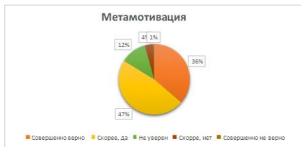
Рис. 6. Распределение ответов на вопросы, связанные с компонентом проактивности «метамотивация»

Как показал анализ, лидирующую позицию в структуре поведения респондентов занимает такой компонент проактивности, как «метамотивация». Абсолютное согласие с данными суждениями высказали 36% респондентов. Согласились с его наличием еще 47% респондентов. Таким образом, у абсолютного большинства участников опроса (83%) в поведении присутствует данный компонент проактивности (рис. 6).