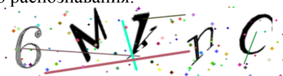
Рис. 1. Сгенерированная капча

Основным элементом изображения, генерируемого системой, являются символы алфавита. Количество символов задается пользователем. Имеется возможность добавить 2 вида шумов на результирующее изображение для затруднения автоматического распознавания.