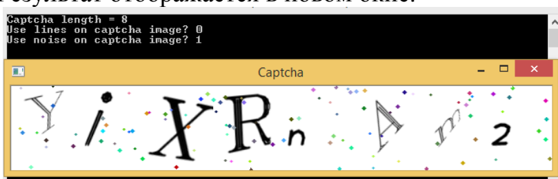
Рис. 2. Рабочая форма программы

Окно системы приведено на рисунке 2. У пользователя имеется возможность выбрать количество символов, использование линейного шума, точечного или обоих. Результат отображается в новом окне.