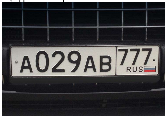
Рисунок 1 – Исходное изображение для эксперимента

Для проведения эксперимента была разработана программа, реализующая вышеперечисленные этапы метода Кэнни, а также реализован этап предварительной обработки – перевод изображения в оттенки серого. Эксперимент проводился над изображением автомобильного номера (рисунок 1) размером 750×520 пикселей с разными значениями порогов. Целью эксперимента является выделение букв и цифр госномера автомобиля.