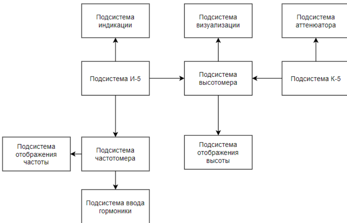
Рис. 1. Структурная схема системы