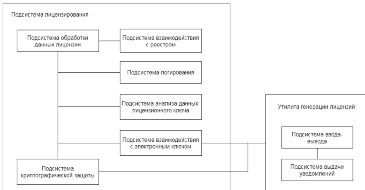
Рис. 1. Структурная схема подсистемы лицензирования

На рисунке 1 приведена структурная схема подсистемы лицензирования, в ее состав входят следующие подсистемы: