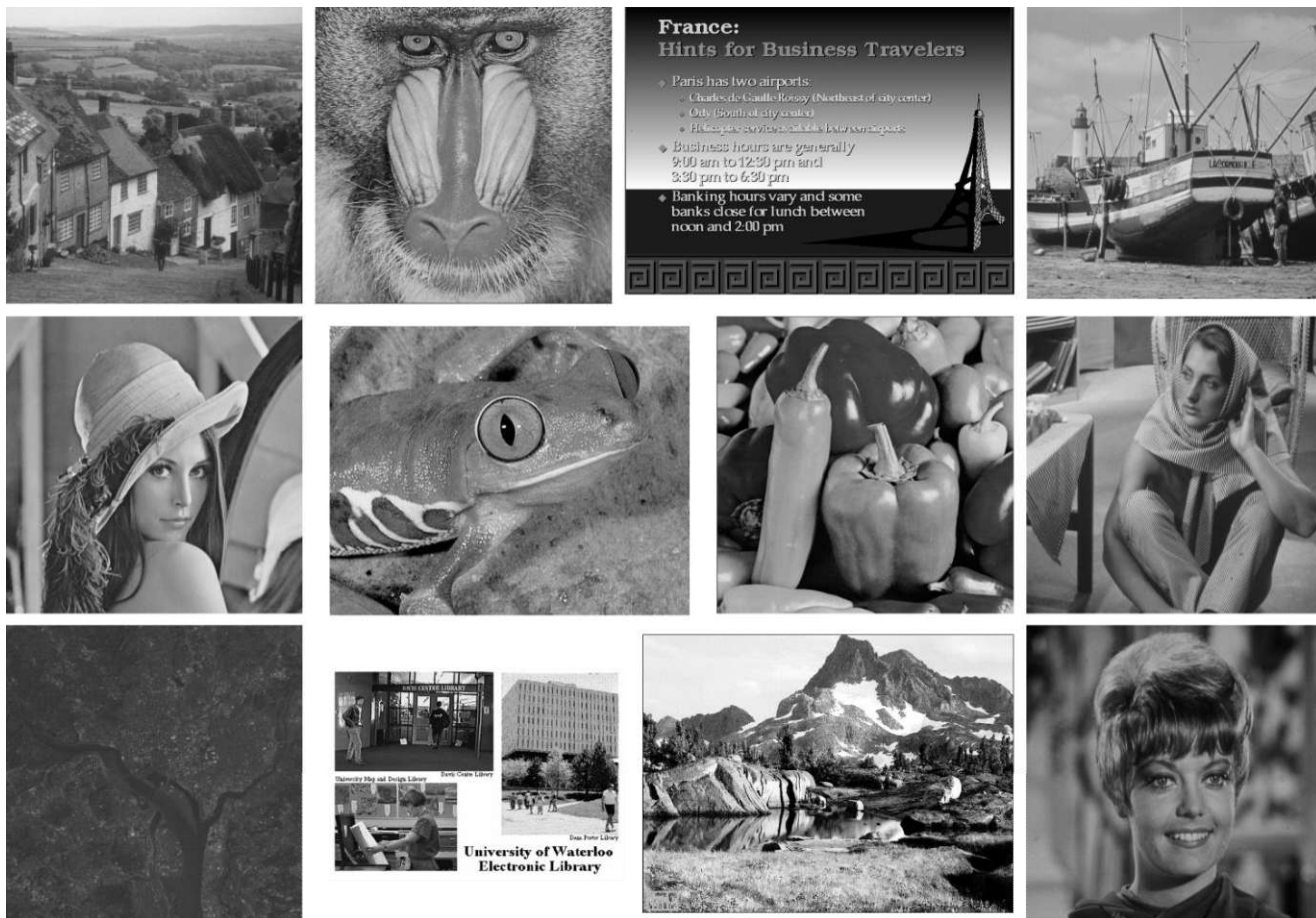
Рисунок 1 – Изображения Waterloo Greyscale Set 2