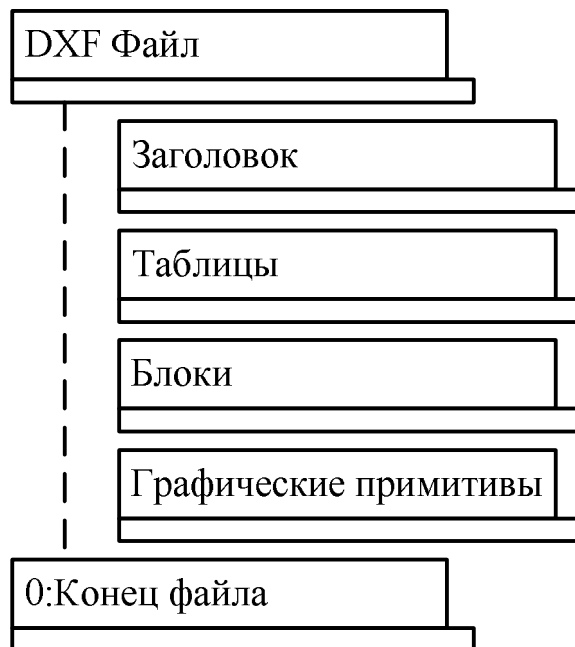
Рис. 1. Структура файла

мации, содержащейся в секции графических примитивов. В секции графических примитивов могут находиться ссылки на конкретные блоки с координатной привязкой блока на чертеже. Один и тот же блок может многократно появляться на чертеже, используя разную координатную привязку и параметры ориентации.