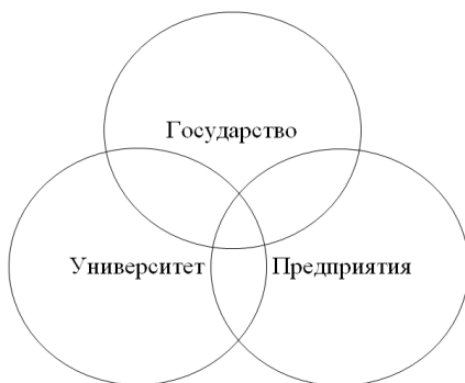
Рис. 1 Модель «Тройной спирали»

На практике «тройная спираль» выражается в том, что университеты могут вносить свой вклад в развитие промышленности через создание новых предприятий и трансфер технологий. Бизнес может оказывать образовательные услуги и проводить исследовательские работы, если это не противоречит основной деятельности предприятий. То же самое действует для государства, которое теперь выступает в роли общественного предпринимателя и венчурного инвестора в дополнение к своей традиционной законодательной и регулирующей роли.