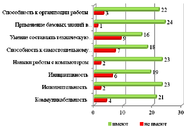
Рисунок 3 – Оценка работодателями профессиональных компетенций выпускников ДГТУ

Предприятиям было предложено оценить качества и компетенции, которыми обладают выпускники ДГТУ.