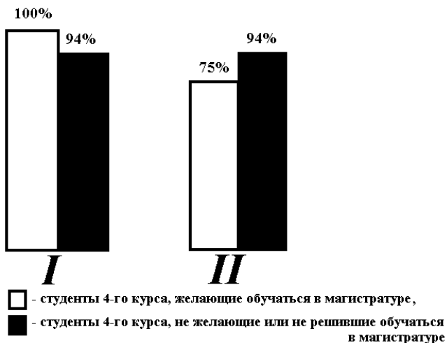
Рисунок 2 Результаты анкетирования:( I – развитие личностных профкомпетенций,II – партнёрские отношения с педагогом)

Результаты ответов о необходимости особой методики проведения занятий, основанной на комбинации классического варианта (лекции с самостоятельной работой) со способами стимуляции самообразовательной деятельности (рис. 3): 92 % студентов четвертого курса отметили своё субъективное желание в реализации подобной схемы построения занятий, причём это отметили и 66% второй части опрашиваемых.