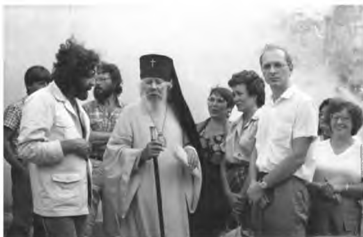
Архиепископ Куйбышевский и Сызранский Иоанн (Снычев) на встрече со сторонниками возвращения городу исторического имени. Апрель 1990 г.