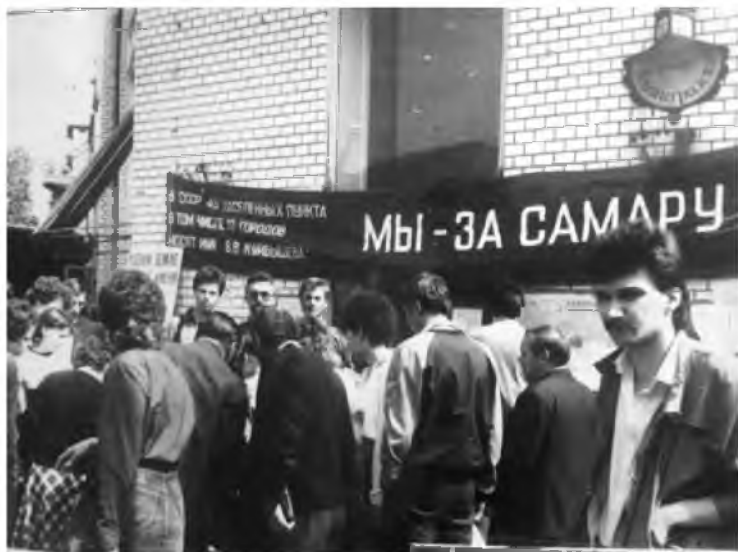
Пикет по сбору подписей на улице Ленинградской. Лето 1989 г.