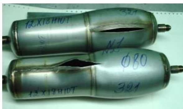
Рис. 2. Разрушение образцов диаметром 80 мм при испытаниях

На рис. 2 приведён пример разрушения опытных образцов. Характерной особенностью является то, что у всех испытуемых образцов перед разрушением наблюдалось вздутие цилиндрической части, изготовленной из стали 321. Также следует отметить, что разрушений по кольцевому сварному шву не зафиксировано.