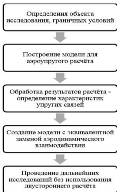
Рис. 1. Схема расчёта

Следует отметить, что решение аэроупругой задачи не исключается полностью, она решается в стандартном объёме на первом этапе исследований для определения параметров эквивалентной системы. Схема расчёта при этом выглядит так, как показано на рис. 1.