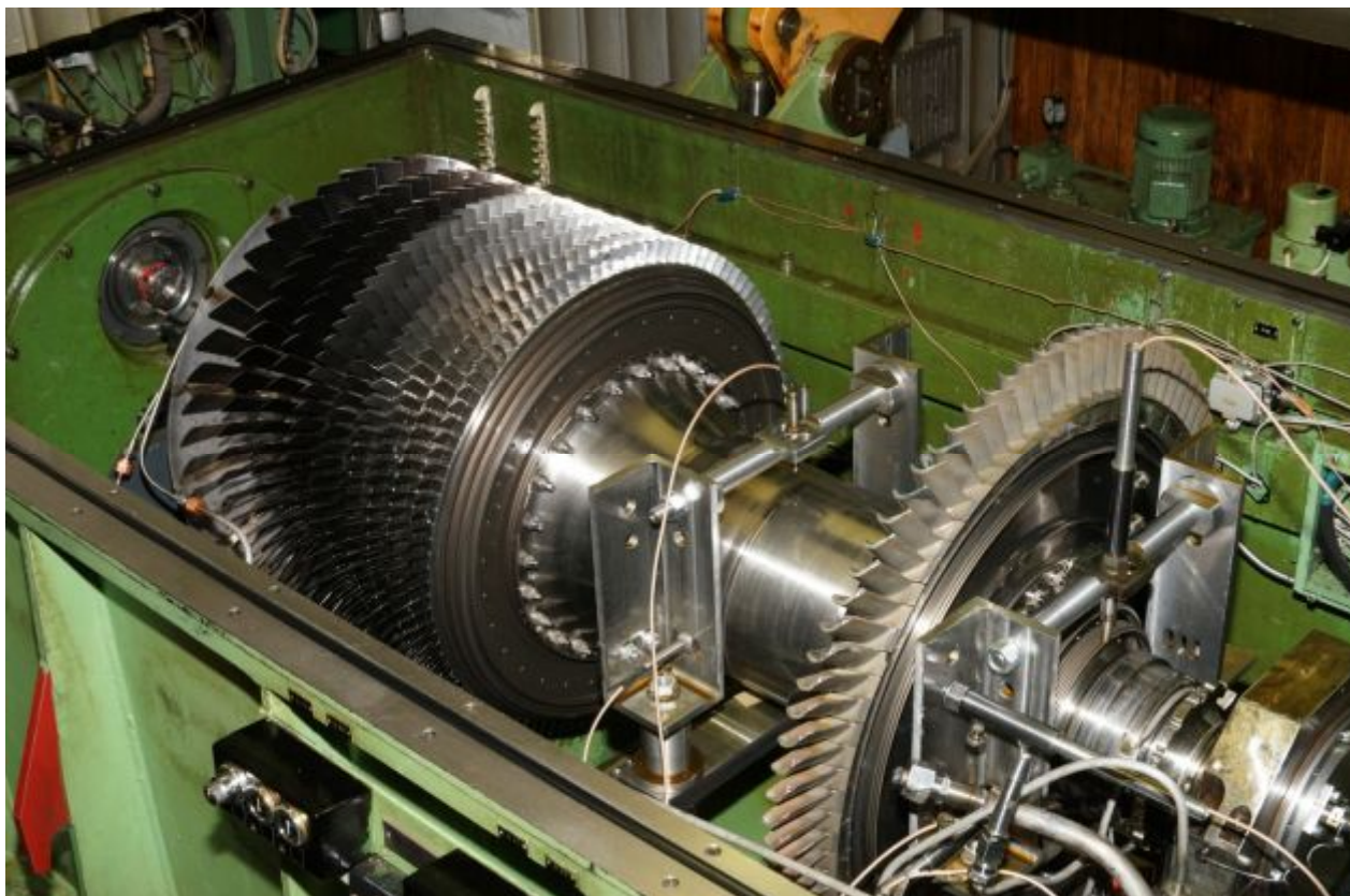
Рис. 1. Общий вид установки на вакуумном балансировочном стенде

(НД) и элементы опор, спроектирована таким образом, чтобы максимально достоверно смоделировать жёсткостные характеристики РВД в составе авиационного двигателя АЛ-31Ф (рис. 1).