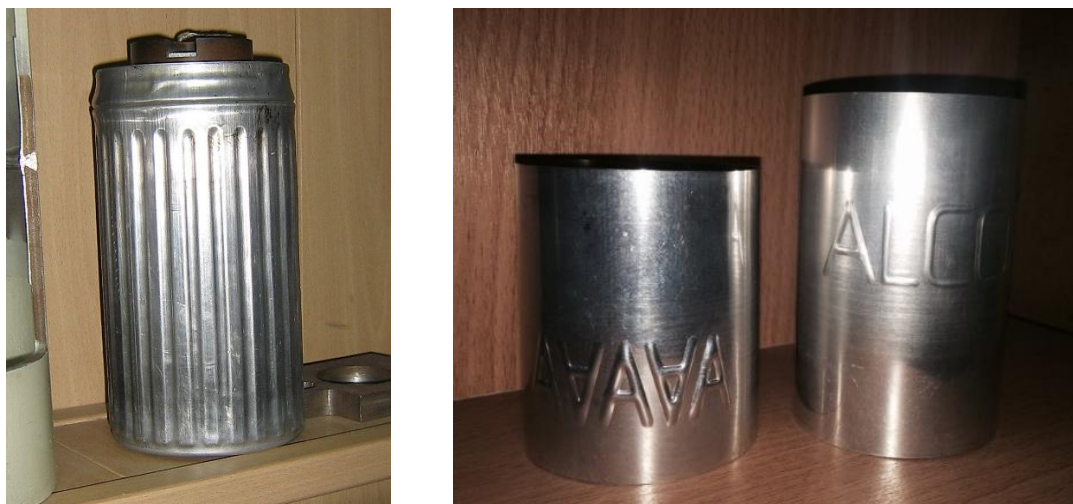
Рис. 1. Фото корпуса конденсатора и фото банки с логотипом Alcoa

Многие полые детали содержат на боковой поверхности различного рода рельеф, получаемые формовкой. Например, это корпус алюминиевого конденсатора с отформованными на боковой поверхности ребрами жесткости, или пищевые банки с отформованным рельефом названия фирмы и другие. Фото корпуса конденсатора и фото банки с логотипом Alcoa представлены на рисунке 1.