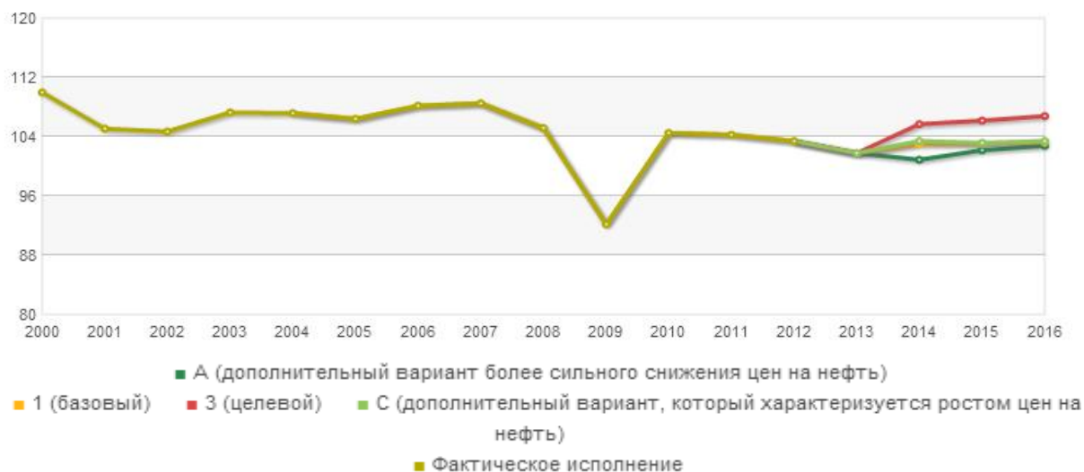
Рис. 2. Прогноз социально-экономического развития Российской Федерации на 2014 год и плановый период 2015 и 2016 годов. ВВП, темп роста, %

На основании данных Министерства финансов РФ, прогноз социально-экономического развития Российской Федерации на 2014 год и плановый период 2015 и 2016 годов представлены на графике (рис. 2).