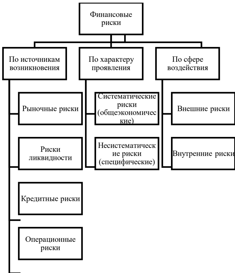
Рисунок 1 - Классификация финансовых рисков

Проведем анализ финансовых рисков на примере компании ООО «ИЦ Гостест», зарегистрированной по адресу Самарская область, Кинельский район, с. Чубовка, пр-д Балтийский (Промышленная Зона), дом 11, второй этаж, помещение 2/5. Основная деятельность компании связана с арендой и лизингом