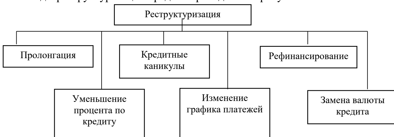
Рис.2. Виды реструктуризации коммерческого кредита

Виды реструктуризации кредита приведены на рисунке 2.