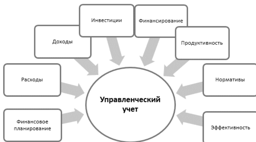
Рисунок 2 – Система управленческого учета

Управленческий учет – это система, позволяющая предприятию упростить и обезопасить процессы сбора, регистрации, обобщения информации о деятельности предприятия [1]. Система управленческого учета включает в себя несколько направлений осуществления и обеспечения функционирования предприятия, система управленческого учета в общем виде представлена на рисунке 2.