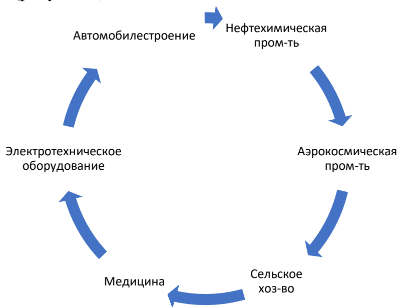
Рисунок 2 - Объекты инвестирования Самарской области

В Самарской области есть много возможных направлений для инвестирования (рисунок 2).