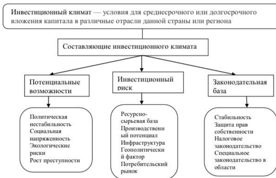
Рисунок 1 - Классификация составляющих инвестиционного климата страны

Составляющие инвестиционного климата как взаимодействуют между собой, так и имеют влияние друг над другом (рисунок 1).