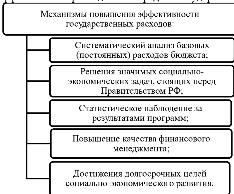
Рисунок 1 – Механизмы повышения эффективности государственных расходов [2, с.172]

На рисунке 1 представлены основные меры, направлены на увеличение и обеспечение эффективности расходования средств государства.