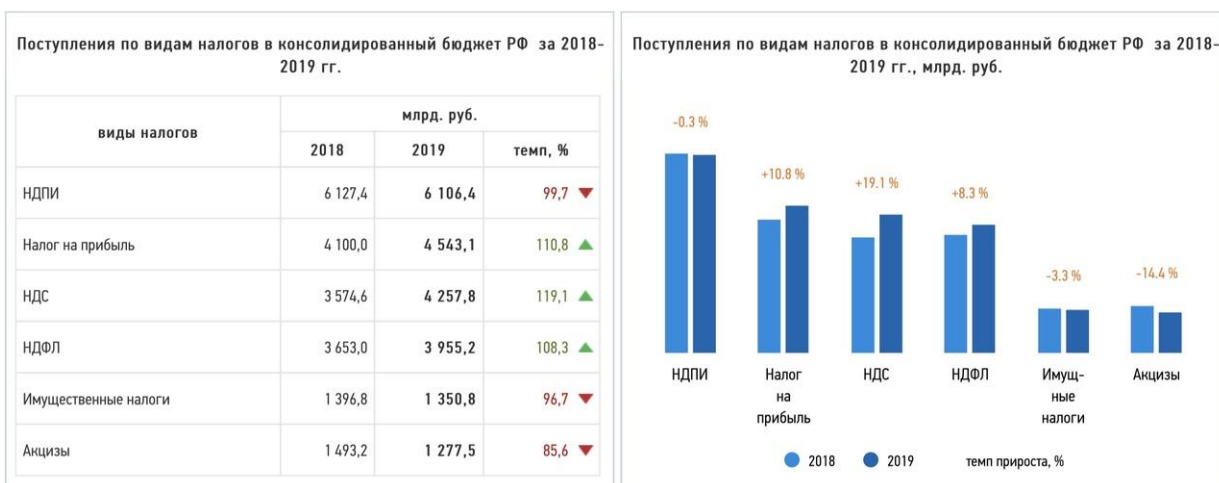
Рисунок 2 – Поступления по видам налогов в консолидированный бюджет РФ за 2018-2019 гг., млрд. руб.

Первоочередными задачами совершенствования налоговой системы должны быть осуществление ее незыблемой стабильности, реформирование налогового федерализма, направленного на обеспечение стабильных поступлений федерального, региональных и местных бюджетов. Материализация рекомендованных мер будет способствовать рациональному, последовательному развитию налоговой политики, осуществление предложенных процедур обеспечит прочность, сбалансированность правительственных и частных интересов.