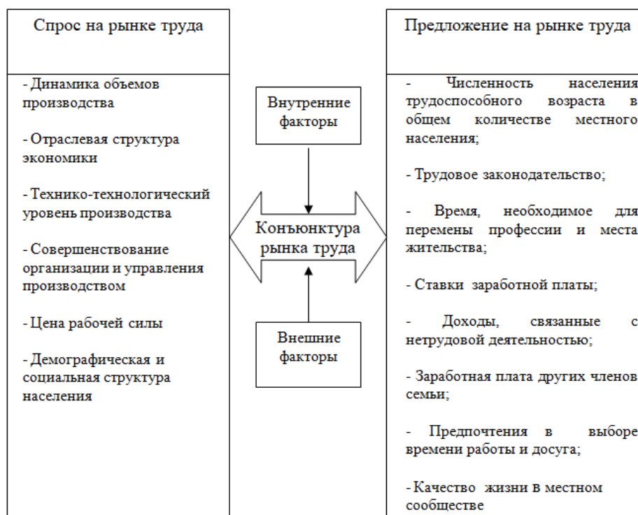
Рисунок 1 - Факторы, оказывающие влияние на изменение конъюнктуры рынка труда

Конъюнктура рынка труда – это соотношение спроса и предложения в разрезе всех его составляющих структур. Изменения конъюнктуры на рынке труда происходят под воздействием целого ряда факторов (рисунок 1).