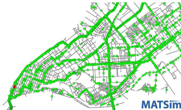
Рис. 1. Моделирование движения транспортных средств.

Каждый эксперимент повторялся для различных коэффициентов допустимой загрузки дорожной сети. Коэффициент загрузки дорожной сети определяет долю плотности транспортного потока, используемого при моделировании, относительно плотности потока в реальной дорожной сети. Например, если в системе моделируется движение 10% от общего количества транспортных средств, то коэффициент загрузки дорожной сети принимают равным 0.1.