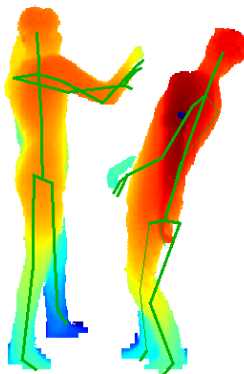
Рис. 2: Логическая программа обнаружила, что один человек ударил другого человека в лицо, и выдала сообщение «Зарегистрирован удар рукой в лицо!»

Предикат a_hand_of_a_person является недетерминированным. Этот предикат возвращает координаты рук людей, обнаруженных в видеопотоке 2 :