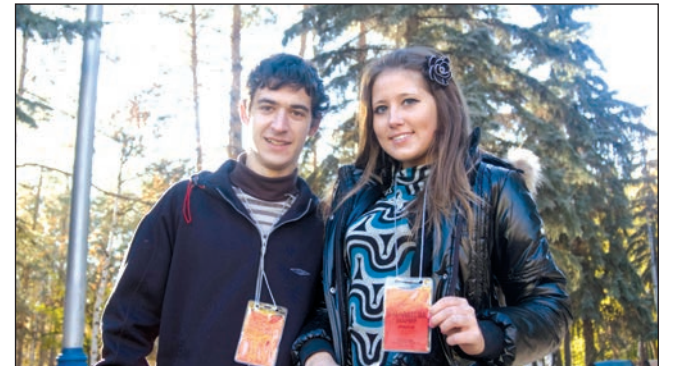
Посвящение первокурсников на механико-математическом факультете