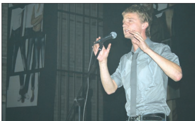
Фоторепортаж с общеузовского концерта, посвященного первокурсникам