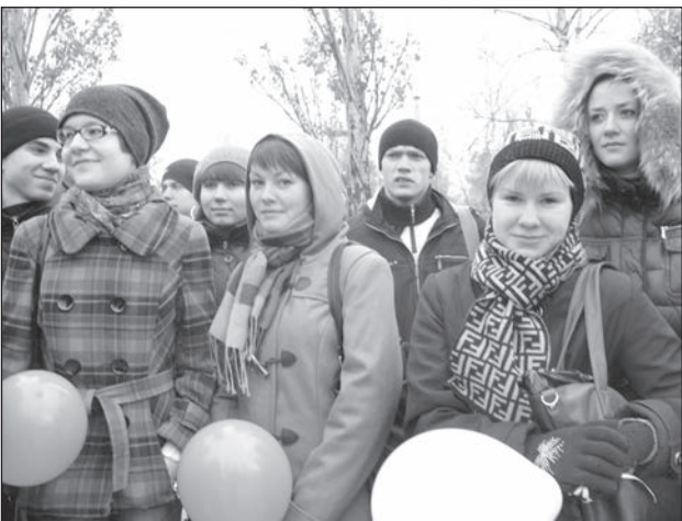
На открытии памятника М. В. Ломоносову у главного корпуса СамГУ

Выходец из крестьянской поморской семьи, обучившись грамоте у дьячка, Ломоносов пристрастился к чтению и самостоятельно изучил «Граматику» М. Смотрицкого, «Арифметику» Л. Магницкого и поэтический перевод «Псалтыри» С. Полоцкого, которые называл «вратами своей учености». В 1730 г. он ушел с рыбным обозом в Москву и поступил в Славяно-греко-латинскую академию, где в тяжелых материальных условиях за 5 лет прошел 12-летний курс обучения и был отправлен для продолжения учебы в Петербургскую академию наук. В 1736 г. среди лучших студентов Академии Ломоносова направили в Германию для изучения химических, горных и других наук. По возвращении оттуда в 1742 г. он стал адъюнктом Петербургской академии наук и приступил к научной деятельности. В 1745 г. Михаил Ва-