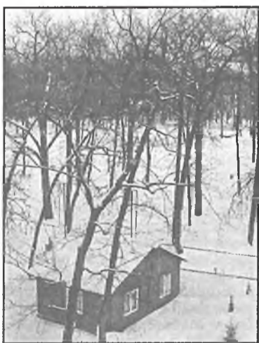
Домик старого фонда

Столь активно ведущееся в последние годы строительство в СамГУ затрагивает не только сферы научные (библиотека, новый учебный корпус) и духовные (храм в честь святой Татьяны), но и также немаловажную для студентов сферу досуга. А отдыхать студенты умеют и любят не только в летний период, но и на зимних каникулах. Так что вопрос: «Куда бы навестить лыжи?» — весьма актуален в любое время года.