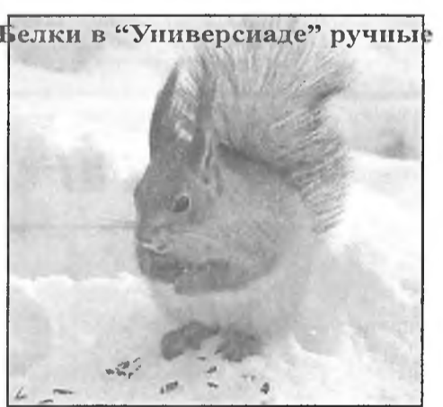
Белки в «Универсиаде» ручные

«Кстати, финансирует строительство «Универсиады» университет. Все деньги внебюджетные: ни министерство, ни