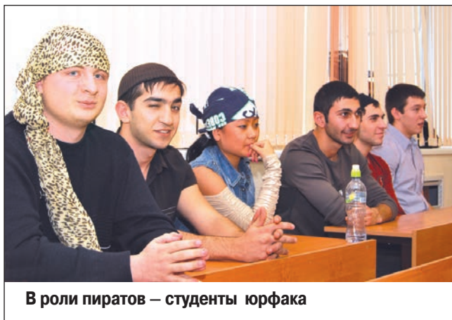
В роли пиратов — студенты юрфака

выяснилось, что сомалийские пираты по-прежнему остаются главной угрозой мировому морскому судоходству. В 2010 году им удалось захватить 27 судов, на борту которых находились 544 человека! Прокуроры нашли в действиях граждан Сомали вопиющий случай нарушения принципов международного морского права. В соответствии с конвенцией «О борьбе с незаконными актами, направленными против безопасности морского судо-